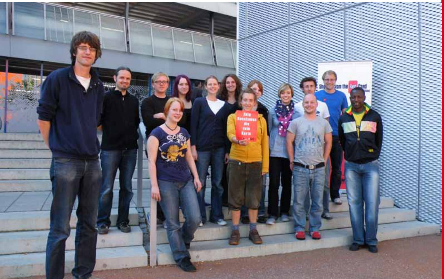
Das Workshopteam von SRtRC

NEUE STADTBÜCHEREI AUGSBURG für alle offen