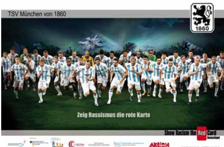
TSV München von 1860