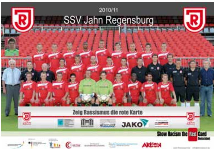
SSV Jahn Regensburg