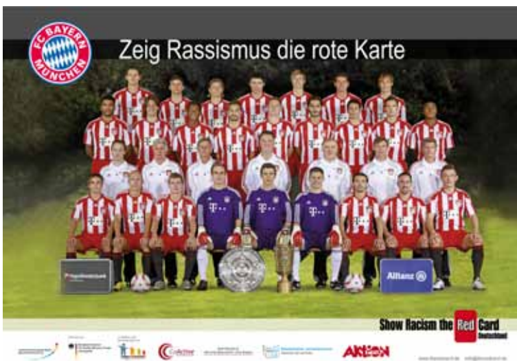
FC Bayern München