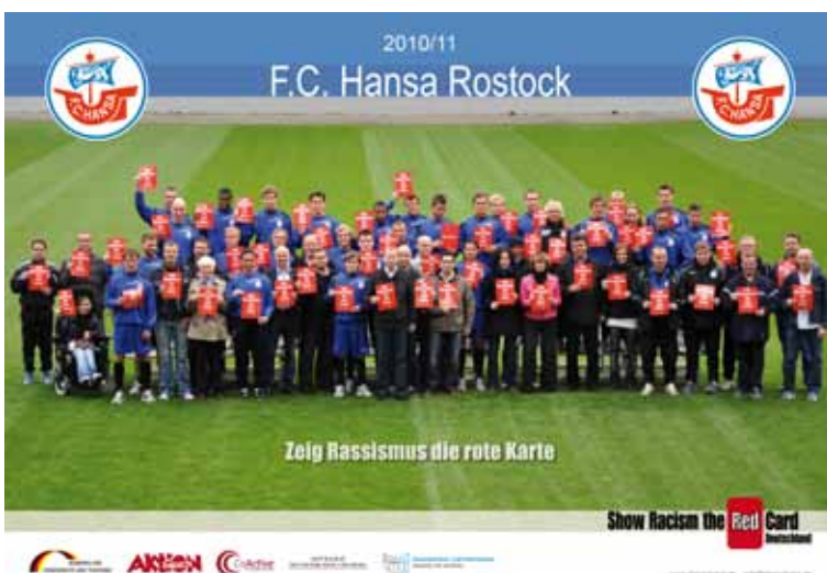
F.C. Hansa Rostock