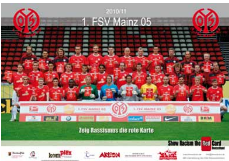
1. FSV Mainz 05