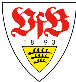
VfB Stuttgart Traditionsmannschaft